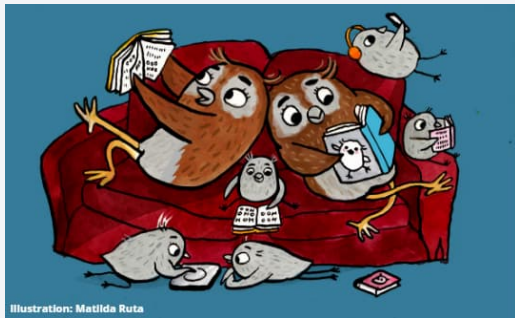
Illustration: Metilda Ruta