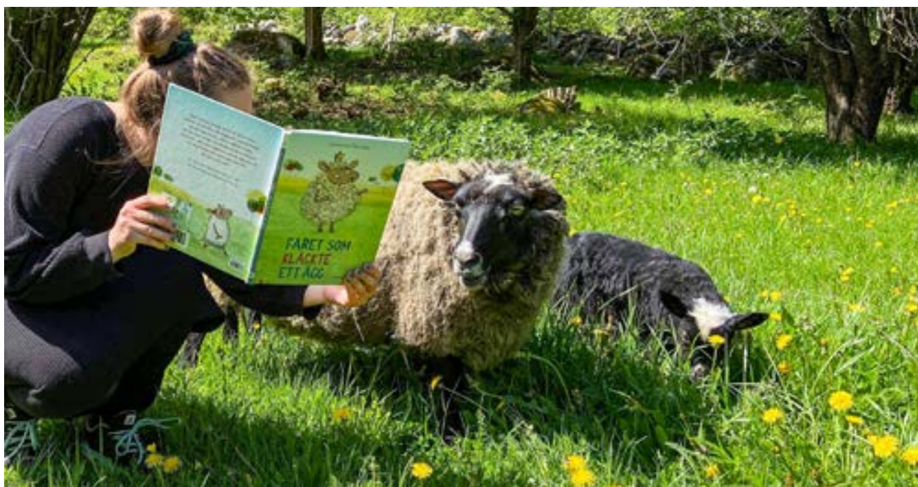
Barnbibliotekarie Maja får sätta ett kryss i uppdrag Sommarboken: läs högt för någon.