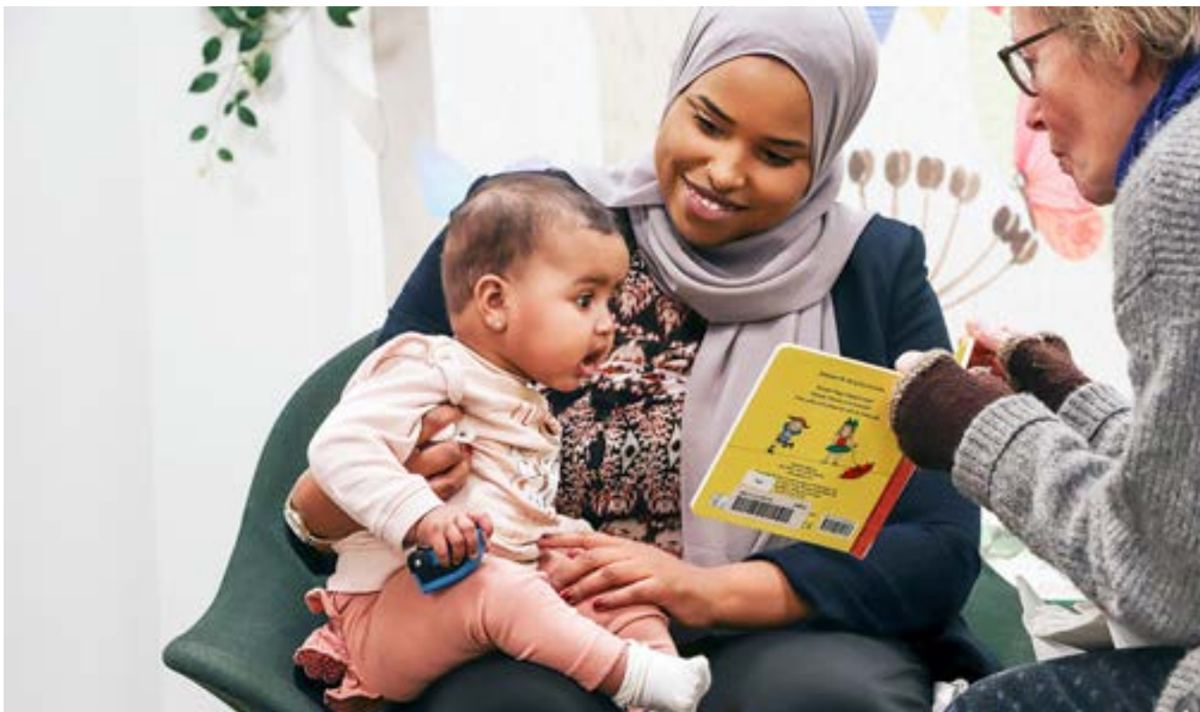
Ryds bibliotek är litet men innehåller allt invånarna kan tänkas behöva, med fokus på barnavdelningen.