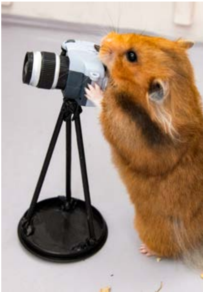
En utlyst fototävling lades ned och boken som planerades kom att handla om Inez själv.

sandet i hamsterbibblans personalsoffa, till exempel. Hur mycket kan en hamster fika och äta på arbetstid?