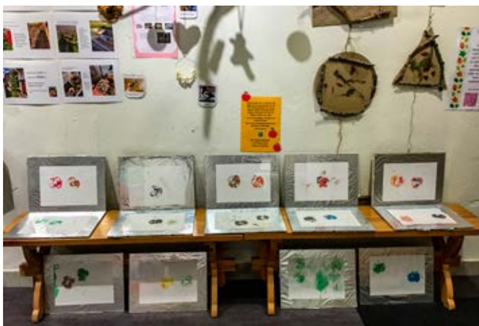
Barnen återanvände skräp från naturen och skapade allt från fågelbord till drömfångare.

sommaren kunde vi öppna upp lite mer, då restriktionerna blev mindre. It-handledningar, släktforskning och vår bokcirkel började igen. Huvudbiblioteket och biblioteksfilialen i Gusum fick nya smartboards under hösten, de har använts i undervisnings syfte och för strömmade föreläsningar.