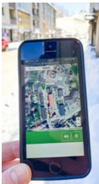
Vi gjorde en GPS-tipspromenad.