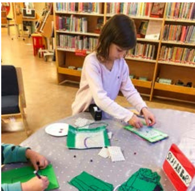
Det har varit viktigt att bibehålla kontakten med barnen.

Det har varit viktigt att fortsätta kontakten i olika former med barnlåntagarna. I samarbete med gruppen Hemkodat kunde några intresserade skolbarn delta