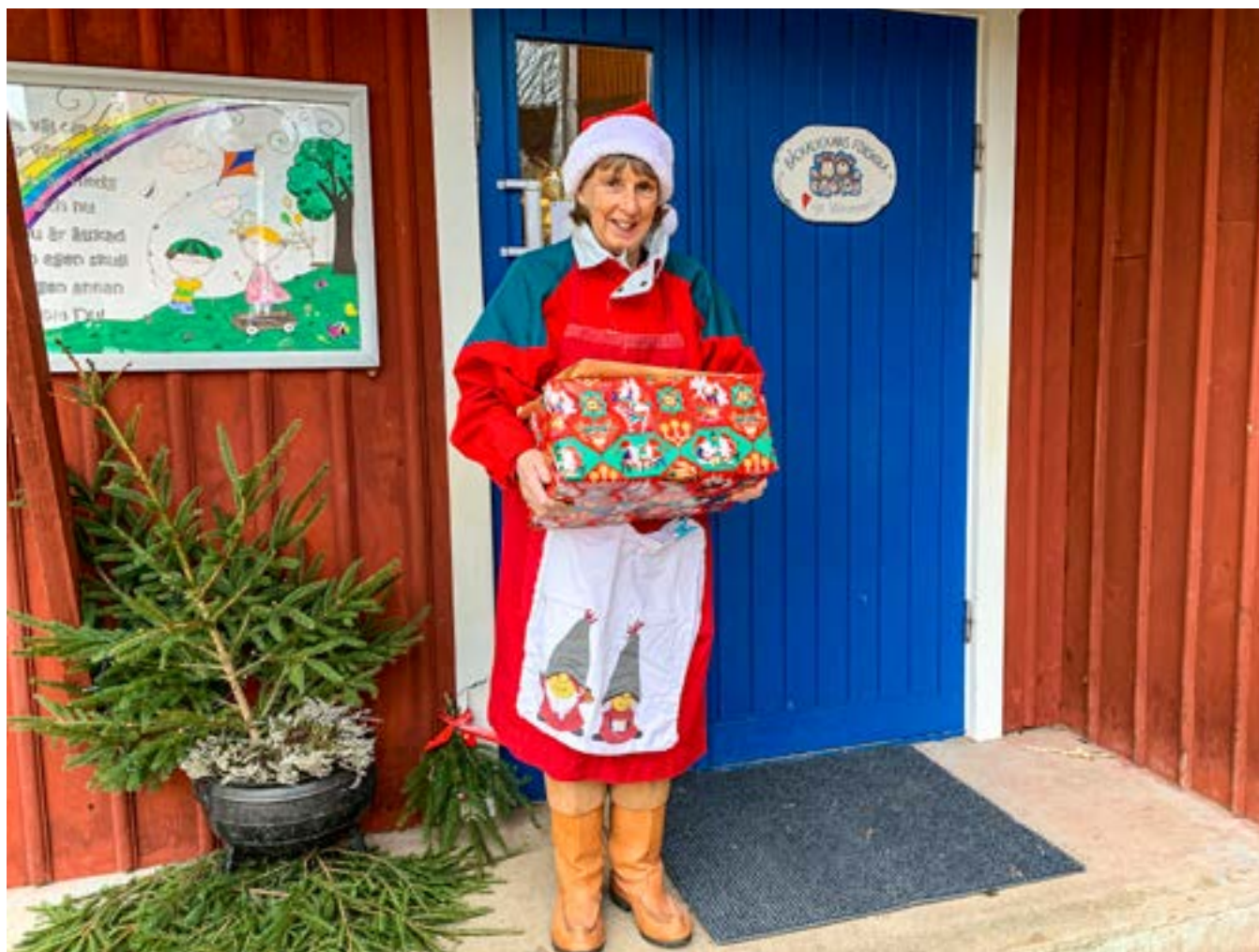
Bibliotekets egen tomtemor besökte alla förskolor i kommunen med ett stort bokpaket.