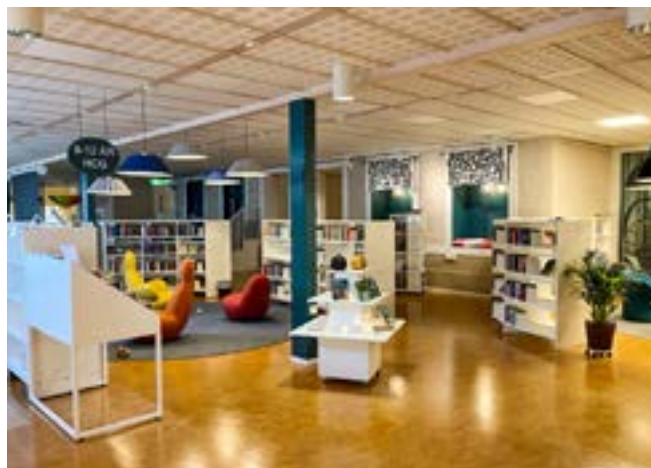
Hyllorna är fräscha, låga och lätta att se över.

Allt bakades ihop till en plan, ritningar och idé. Även om barnavdelningen var det som krävde mest planering behövde vi också fundera på vuxenfackavdelningen, som skulle flyttas till den nuvarande barnavdelningens yta. Kravspecifikationer och upphandling kunde sedan börja!