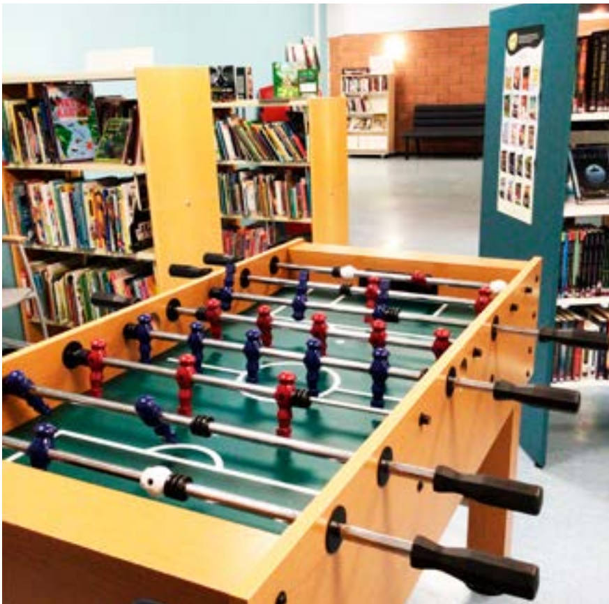
Vi har även analoga spel att prova på.