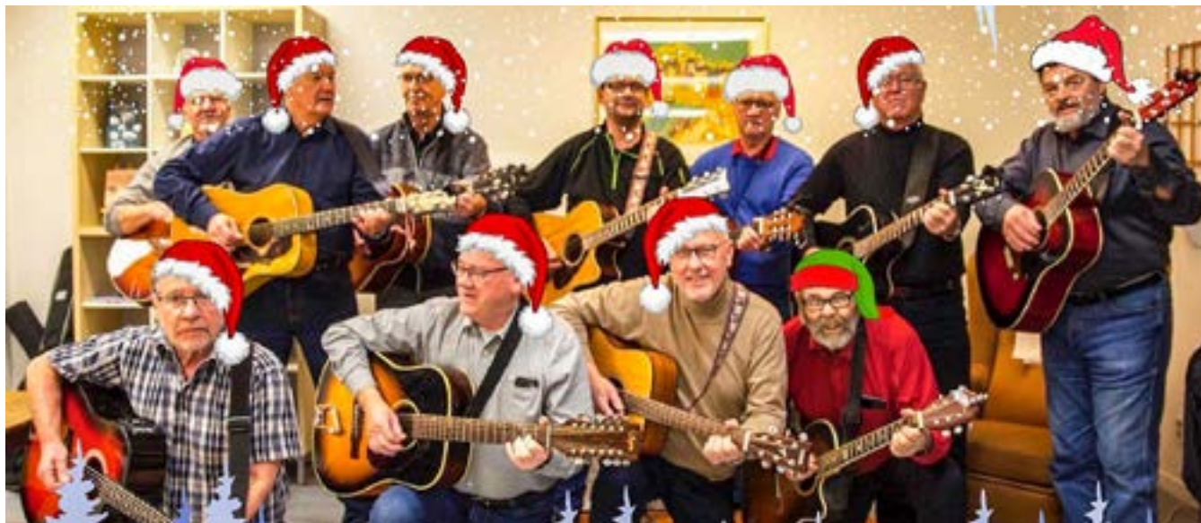
Gitarrorkestern spred julstämning när programverksamheten för 2021 avslutades och med det knöt vi ihop säcken kring ett händelserikt år i Åtvidaberg.

mans med skolorna i kommunen och slog rekord i såväl antal anmälda barn och unga som i antal lästa böcker!