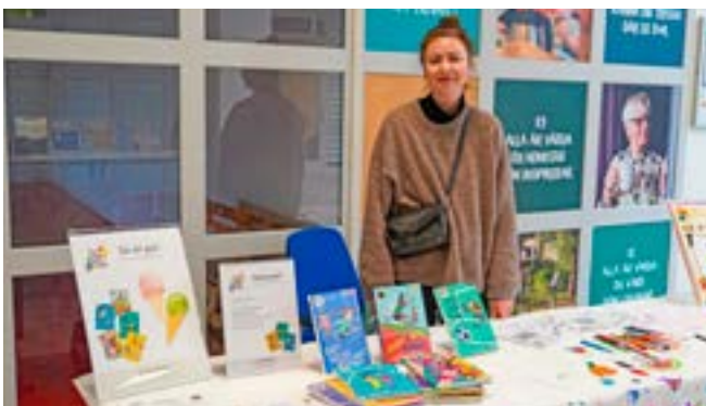
Olika förlag deltog med projektet "Tell your sportstory".

Genom bokimprovisationsteater med Teater Kung och Drottning kunde barnen uppleva nya berättelser