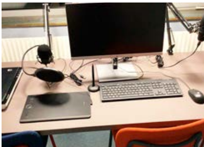
Den digitala verkstaden är så gott som färdig.