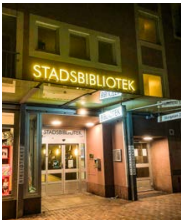
De nya skyltarna lyser varmt i mörkret.

Biblioteket var också en del i en större satsning med löpningar för barn och unga. Under tre veckor var barn- och ungdomsbibliotekarierna med på en liten turné i kommunen. På lite olika platser fanns en