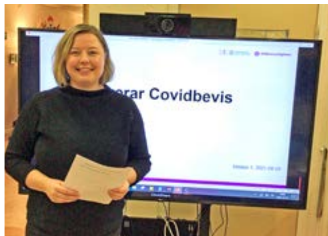
Digitala skärmar för affischering.