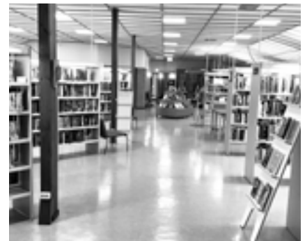
Det nya biblioteksrummet börjar ta form.