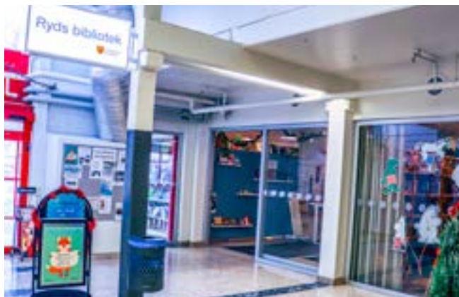
Nytt och centralt inne i gallerian i Ryds centrum.

– Under höstlovet, vecka 44, var det aktiviteter för skolbarn och de två veckorna därefter för barn 0-6 år. Vi fick ett härligt gensvar och det känns som om vi efter de här veckorna har satt oss på kartan i området. Vi har även fått igång ett Språkcafé i samarbete med Ryds hemkyrka. Behovet är stort och gensvaret toppen.