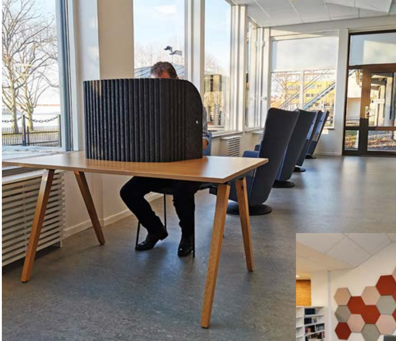
– Göra ljudnivån bättre med hjälp av ljudabsorbenter, både portabla och fasta.

– Göra våra trivselregler tydligare med hjälp av informationsskyltar i lokalen, skyltarna är försedda med qr-koder som leder till översatta trivselregler med inläsningar på olika språk.