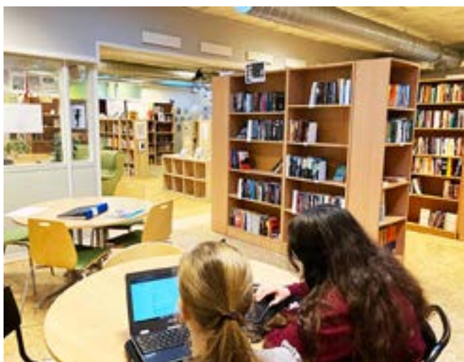
I den nya skolbiblioteksorganisationen anställs 4-5 skolbibliotekarier samt en skolbibliotekssamordnare.

Finspångs bibliotek har under många år erbjudit förskolorna en tjänst där barnbibliotekarien plockar ihop boklådor utifrån önskemål. Förskolorna har