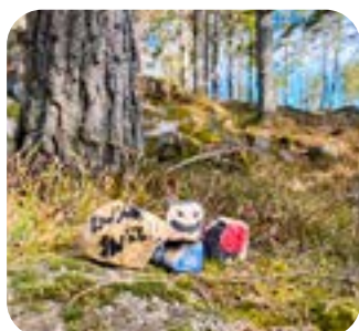
När stenarna var utlagda började stenjakten.

Det senaste pandemiåret har lärt oss att vara mer flexibla och har även lockat till nytänkande. Vi återupptog bland annat samarbetet med Valdemarsviks lokala radiostation RadioWix som vi tidigare samarbetat med när vi spelat in läsprogrammet "Läslust Pratlust" som var en radio-följetong med en förberedelseklass och kommunens friskola. Denna gång spelade vi in radioprogram med teman som Internationella Barnboksdagen och ett program där vi pratade om Götabibliotekens utlåningstopplistor.