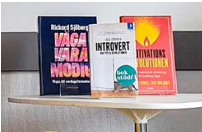
Bokhylla med utvald litteratur i samtalsterapeuternas behandlingsrum på Vårdcentralen.

Inom Bokstöd påbörjades också ett program med