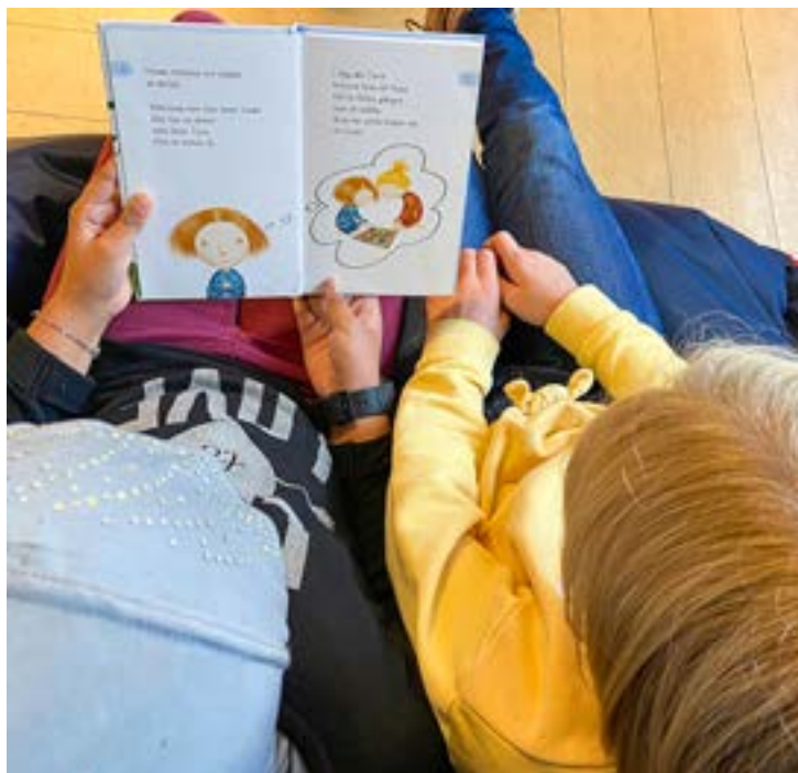
Vi fick ha skolklasser på studiebesök igen.