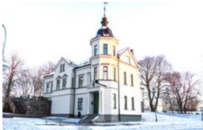
I vackert gammalt slott i Berga by.

Även det här biblioteket är litet, men självfallet innehåller det allt en besökare kan tänkas behöva. Tack