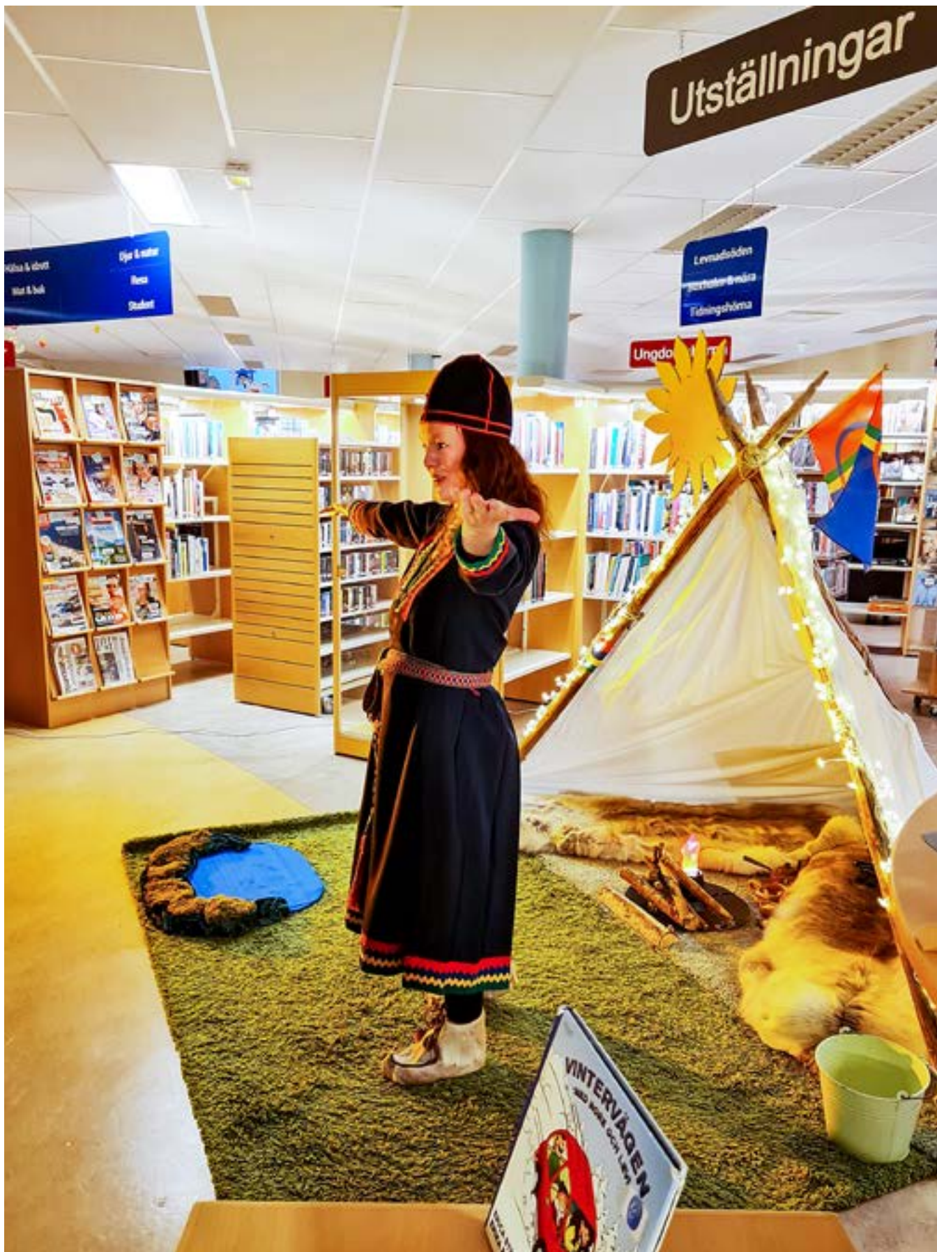
Den samiska skapelseberättelsen och de mystiska hjärtslagen visar vägen i landet där solen skiner på natten.