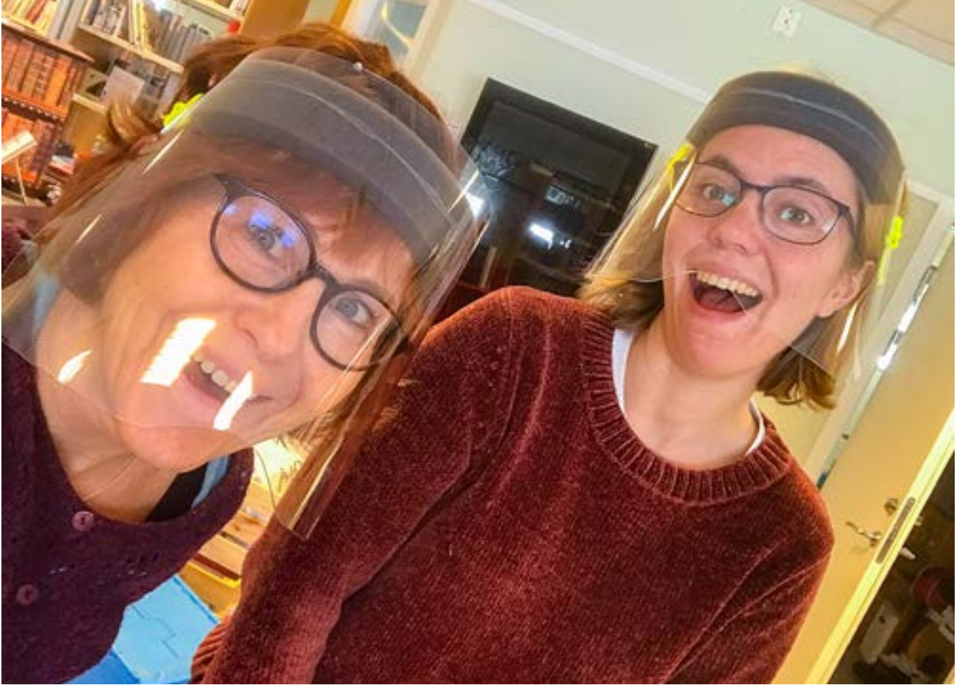
Trots "ni vet vad" har vårt huvudfokus ändå varit våra besökare och ett gott bemötande.